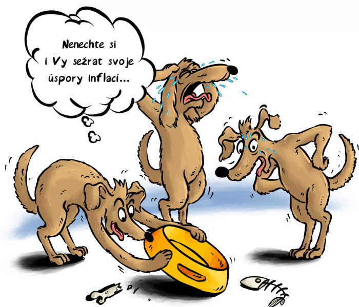
ČÁSTKA NA BĚŽNÉM ÚČTĚ, ČI DOMA 100.000,-

V prvním čtvrtletí roku 2022 se očekává meziroční inflace k 8%, možná až k 10%. Potom ekonomové předpokládají, že by inflace mohla klesat. Pro ochranu financí proti inflaci dnes existuje řada nástrojů. Ať jsou to různé typy dluhopisů, nemovitostní fondy či komodity. Rádi vám v tom poradíme.